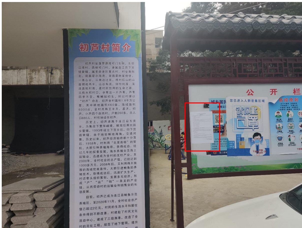
图 3.2-4 初芦村现场公示照片

在项目所在地初芦村以及小芦公示栏现场张贴本项目环评征求意见稿公示，公示期为10个工作日（2021年1月25日—2021年2月5日），公示现场照片见图3.2-4。