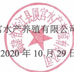
图 2.2-2 委托书