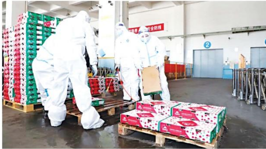
工作人员对货物内外包装进行消毒

提供货物清单等信息。对于没有报关单、检验检疫证明、核酸检测证明、消毒证明或者各类证件与货物不符的车辆和货物不得入场。