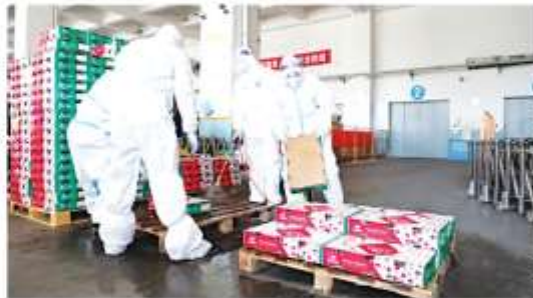
工作人员对货物内外包装进行消毒

海都讯(记者 柳小玲 通讯员 何美蓉 文图) 为切断新冠病毒冷链物流传播途径,日前,泉州鲤城进口冷链食品集中监管仓启动运营。该仓位于高曾食品园,是鲤城进口冷链食品的首个集中监管仓,没有冷链、消杀、核酸检测、消毒等功能区。鲤城记者获悉,截至目前,已累计进仓货物238批次,532.648吨,未发现阳性样本,守住进口冷链食品疫情防控的“第一道关口”。鲤城海关监管科工作人员表示,鲤城进口冷链食品集中监管仓的运营,为鲤城进口冷链食品提供了“一站式”服务,提高了监管效率,降低了企业成本。鲤城海关监管科工作人员表示,鲤城进口冷链食品集中监管仓的运营,为鲤城进口冷链食品提供了“一站式”服务,提高了监管效率,降低了企业成本。