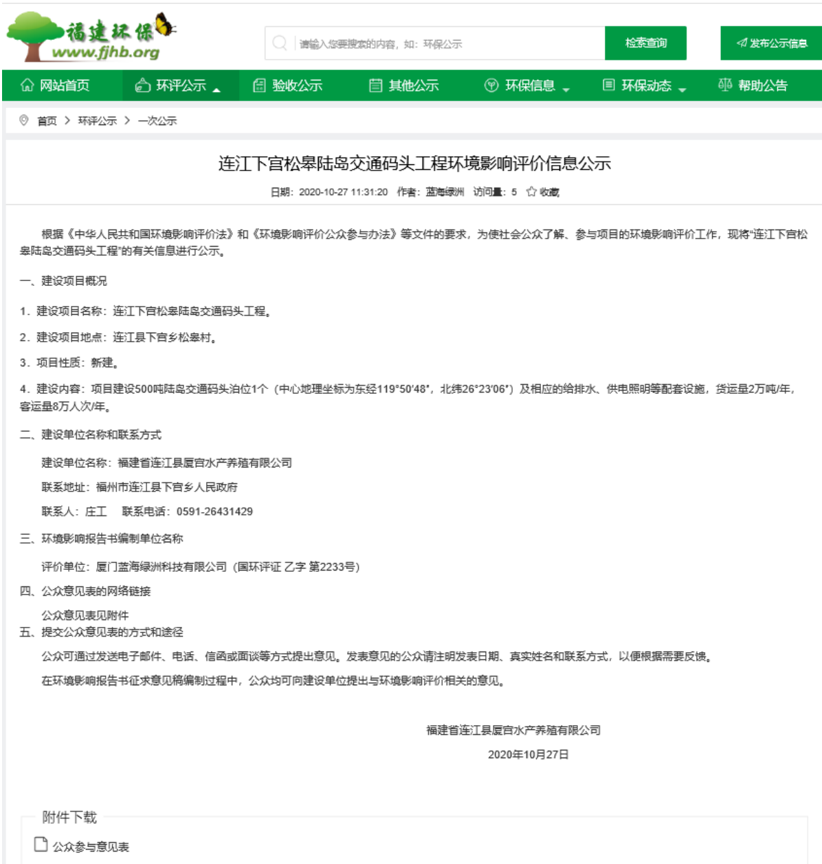
图 2.2-1 福建环保网首次环评信息公示截图