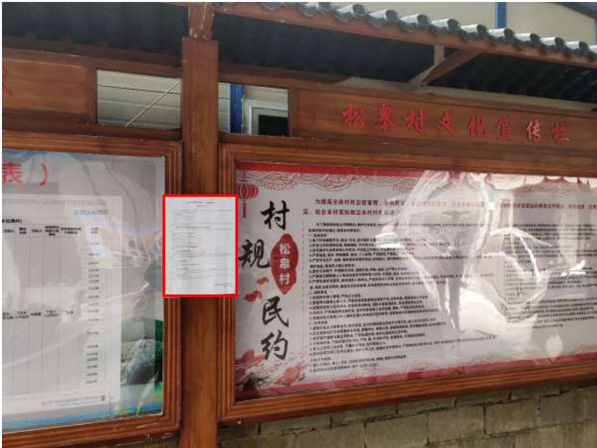
图 3.2-4 松皋村现场公示照片

在项目所在地松皋村公示栏现场张贴本项目环评征求意见稿公示，公示期为 10 个工作日（2021 年 1 月 25 日—2021 年 2 月 5 日），公示现场照片见图 3.2-4。