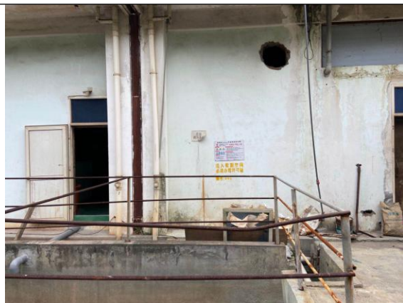
先锋 7-8# 厂房应急池局部图