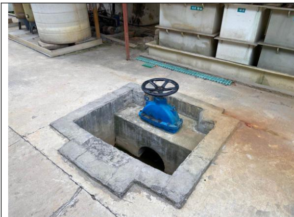
先锋 7-8# 厂房雨水排放口应急阀门