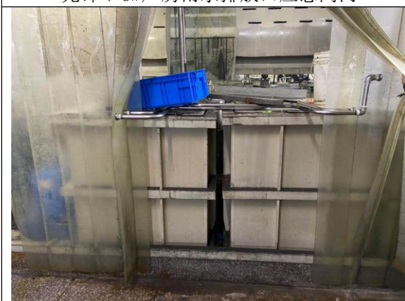
公司应急桶局部图