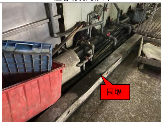
电镀生产车间围堰局部图