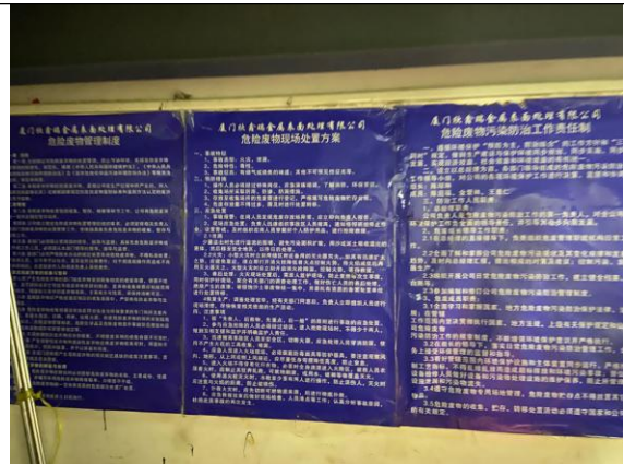
危险废物制度局部图