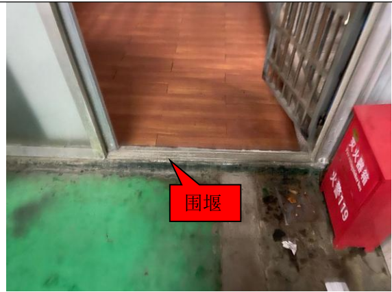
危化品仓库局部围堰图