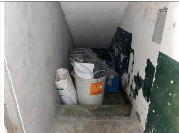
危废暂存间局部图