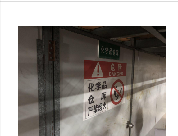
危化品仓库局部图