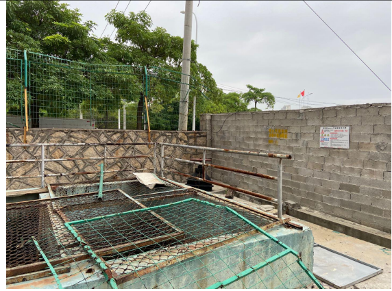
先锋 7-8#厂房应急池局部图