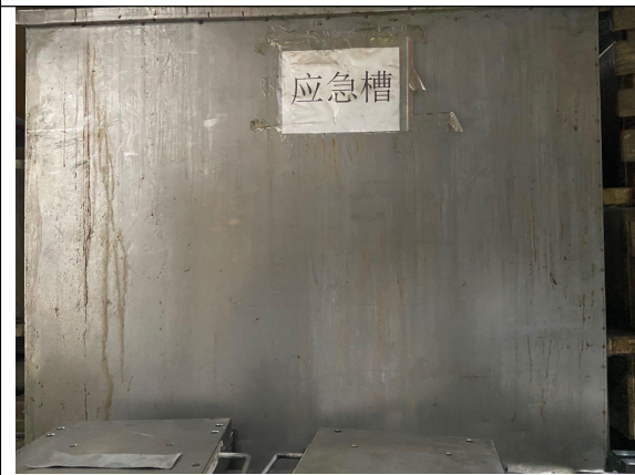
公司应急桶局部图