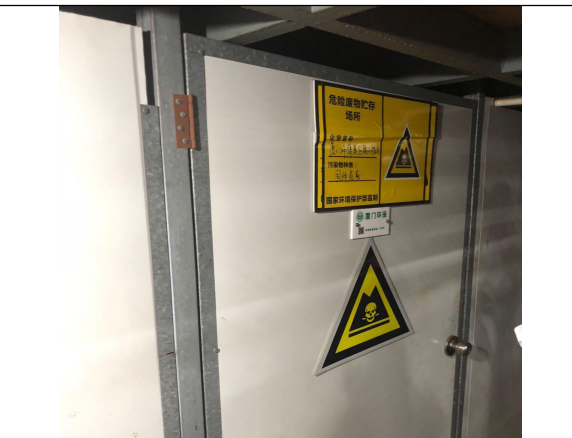
危废暂存间局部图