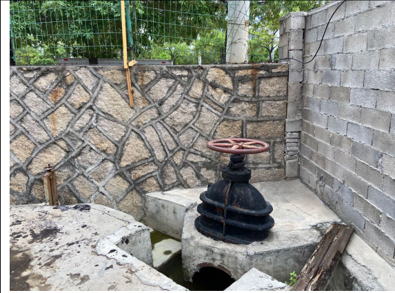
先锋 11#厂房雨水排放口应急阀门