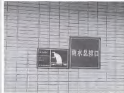
雨水总排口标识牌