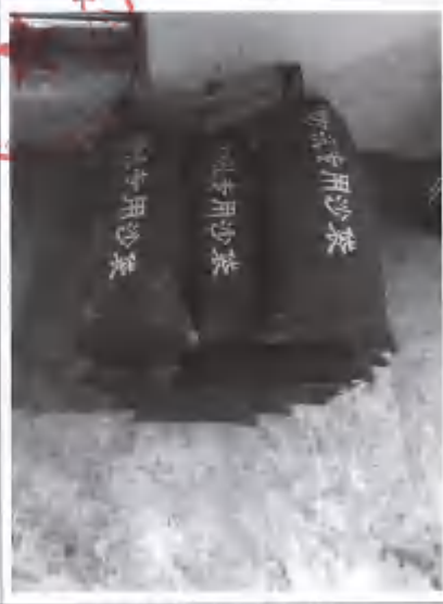
雨水总排口封堵应急沙袋