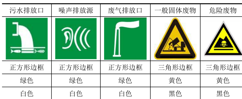
表 5-2 厂区排污口图形符号（提示标志）一览表

规范化排放口：排放口应预留监测口做到便于采样和测定流量，并设立标志（有要求监控的项目应论述）。执行《环境图形标准排污口(源)》(GB15563.1-1995)及《环境保护图形标志-固体废物贮存(处置)场》(GB15562.2-1995)。见表5-2，标志牌应设在与之功能相应的醒目处，并保持清晰、完整。