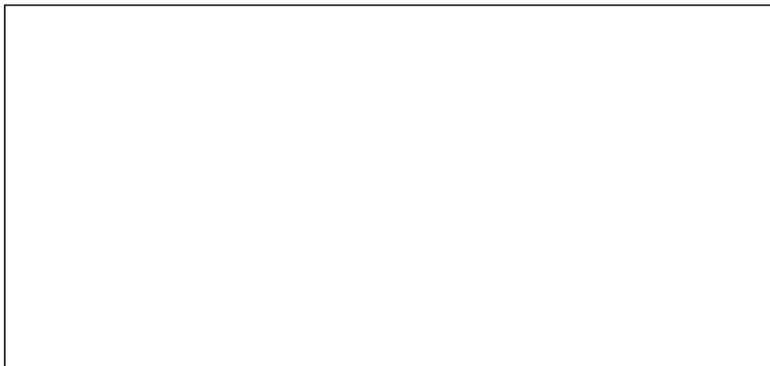
图 2-2 项目生产工艺流程图及产污环节