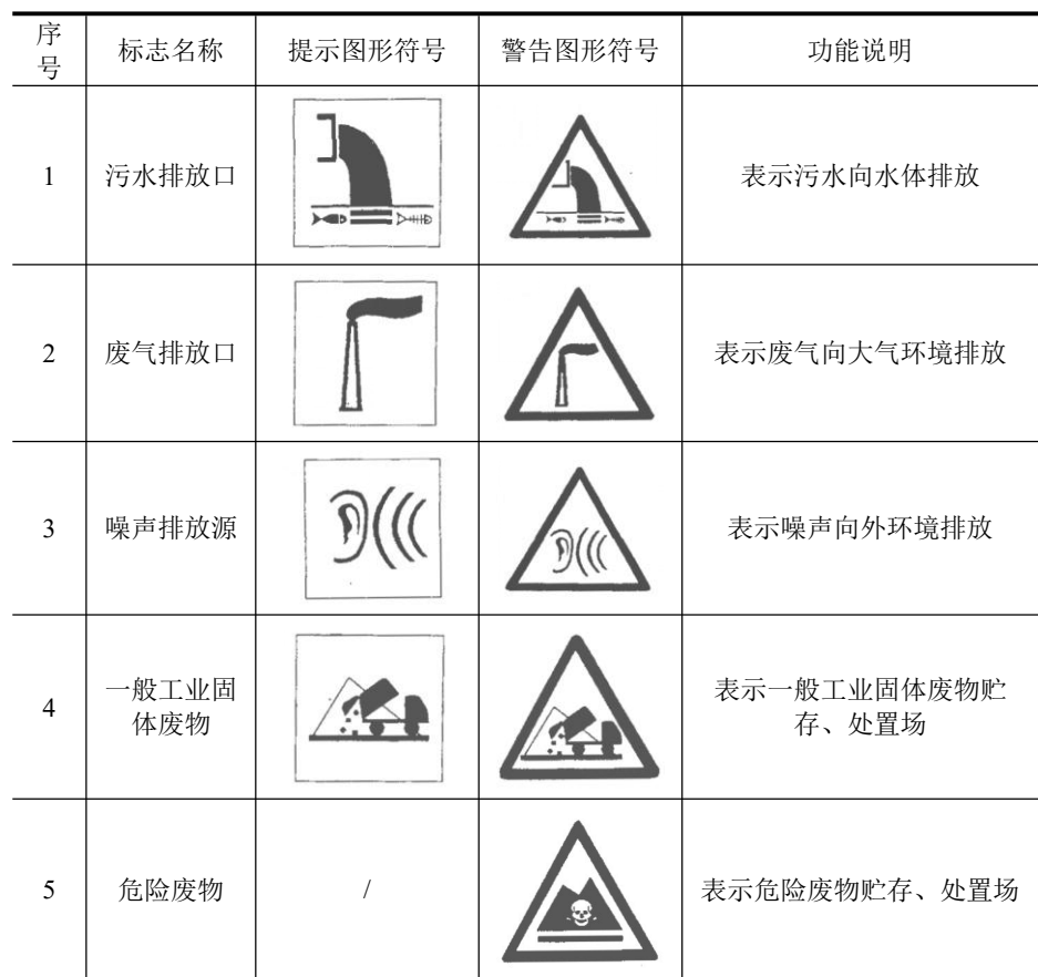
表 5-1 各排污口（源）标志牌设置示意图

本项目设有 3 个废气排放口、1 个废水排放口，排放口应预留监测口做到便于采样和测定流量，并设立标志。污水排放口、废气排放口和噪声排放源图形符号分别为提示图形符号和警告图形符号两种，图形符号的设置按 GB15562.1-1995 执行。