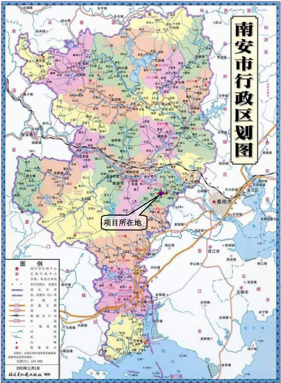
附图 1 项目地理位置图