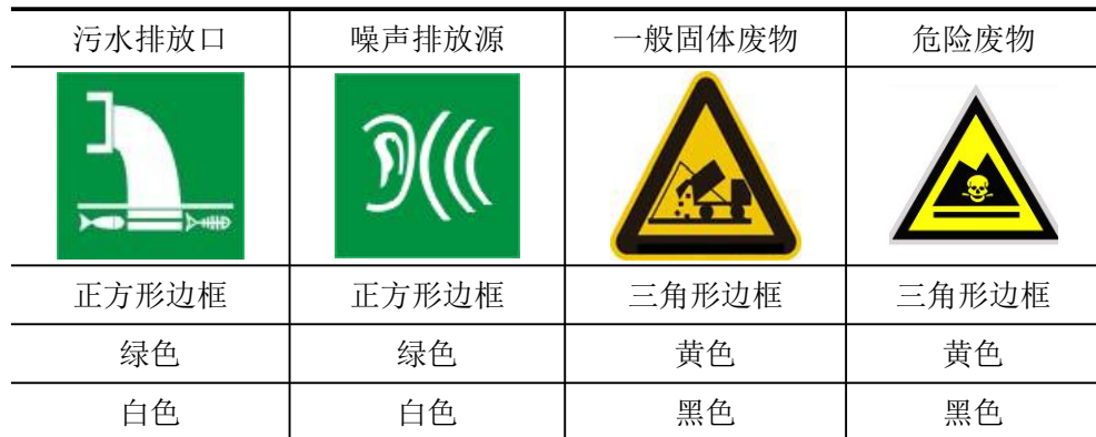
表 5-2 厂区排污口图形符号（提示标志）一览表

规范化排放口：排放口应预留监测口做到便于采样和测定流量，并设立标志（有要求监控的项目应论述）。执行《环境图形标准排污口(源)》(GB15563.1-1995)及《环境保护图形标志-固体废物贮存(处置)场》(GB15562.2-1995)。见表5-2，标志牌应设在与之功能相应的醒目处，并保持清晰、完整。