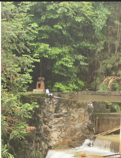
图 4-3 最小生态下泄流量现场照片