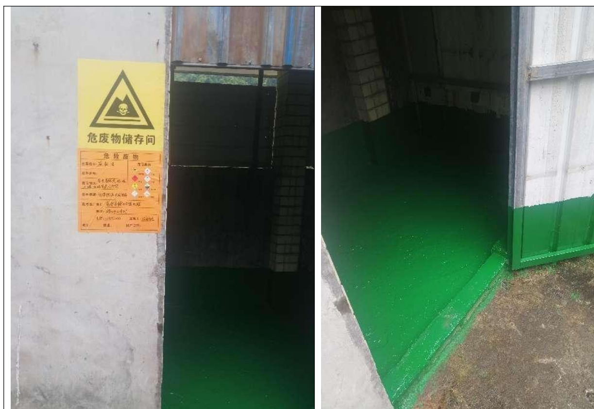
图4-3 危废暂存间照片

运营期产生的生活垃圾由环卫部门统一清运；拦河坝上堆积砂石、枯草、落叶等浮渣定期清理，收集后由环卫部门统一清运。