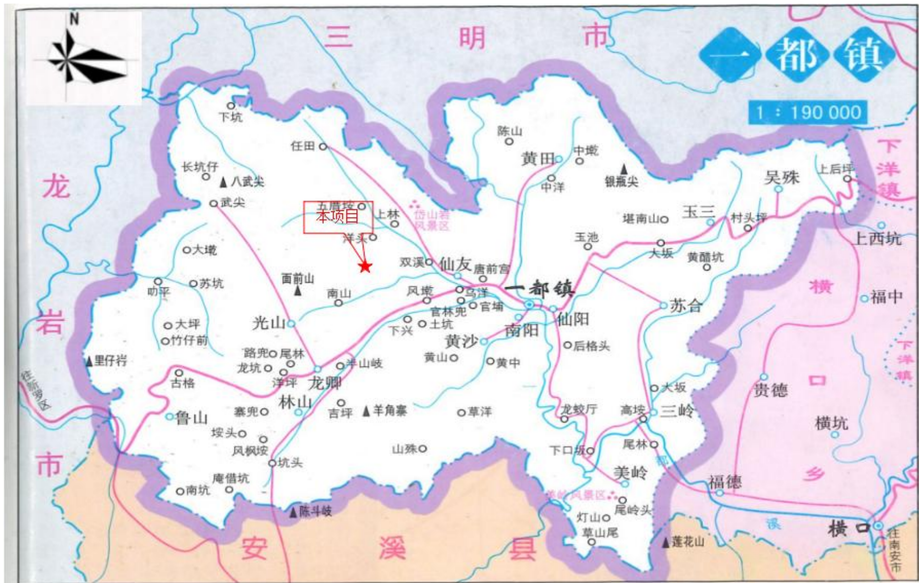
附图 1 项目地理位置图