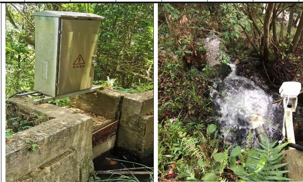
图 4-4 最小生态下泄流量现场照片