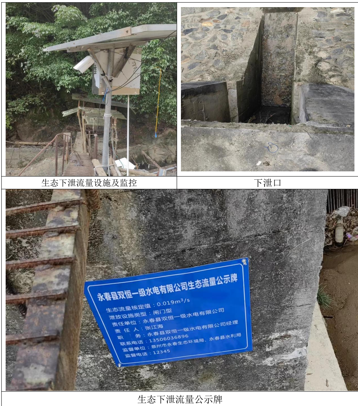
生态下泄流量设施及监控