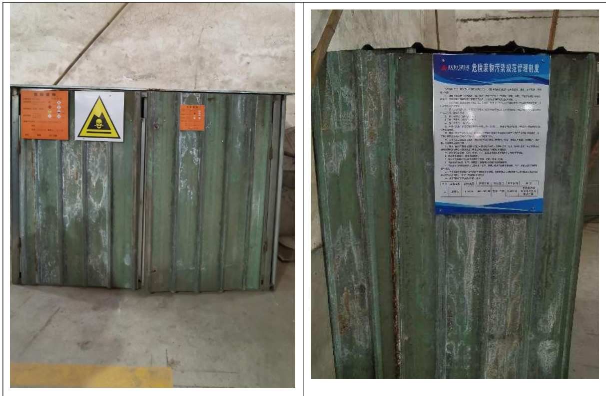
图5-2 项目危废间照片