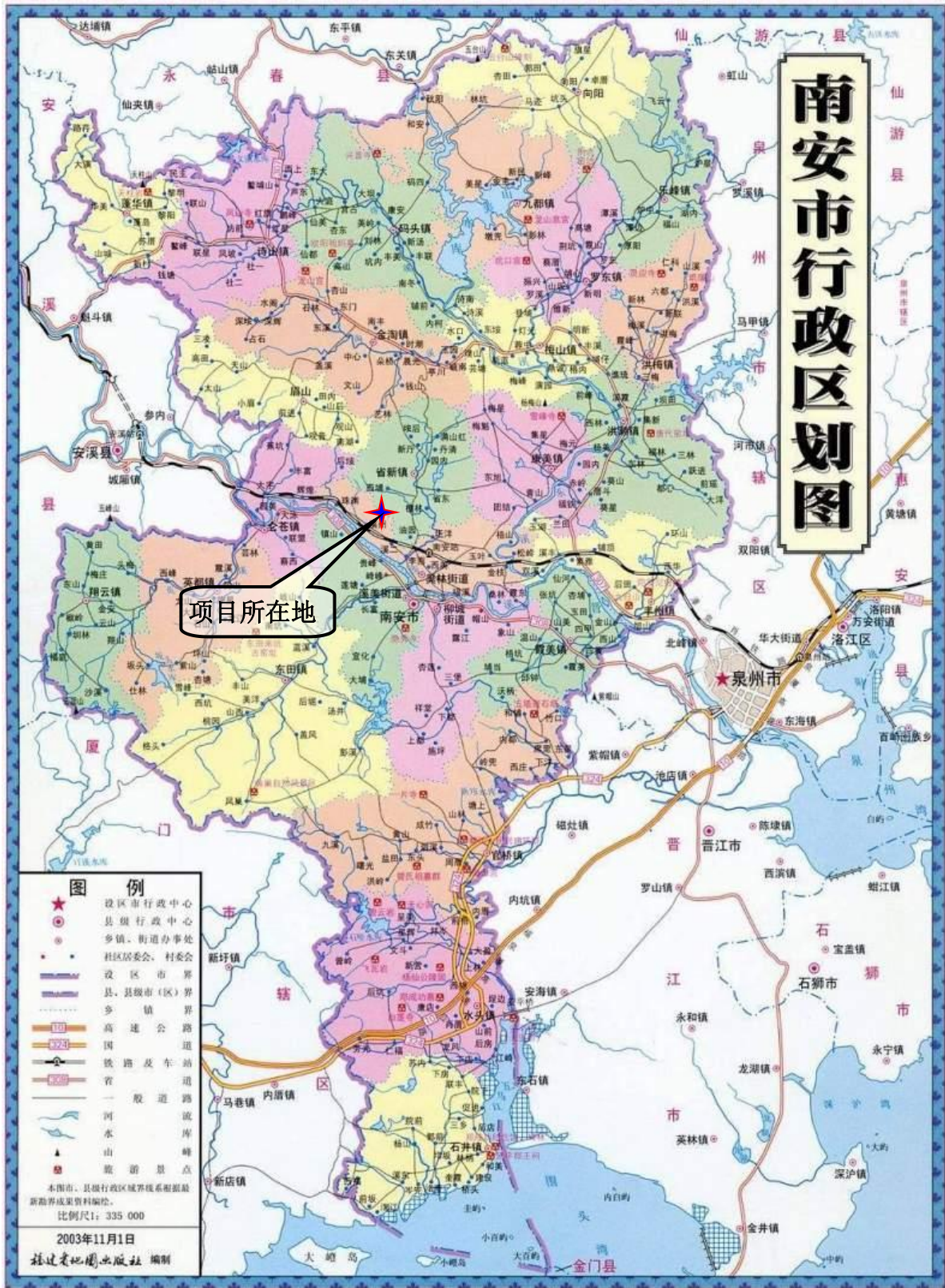
附图 1 项目地理位置图