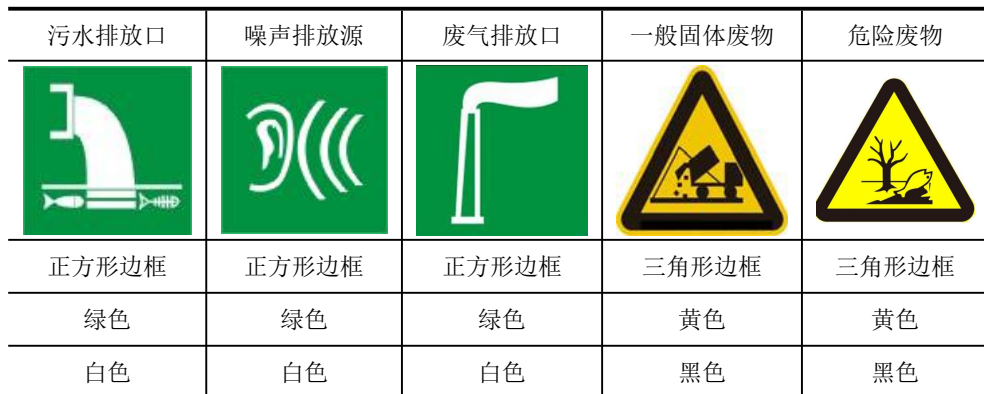
表 5-2 厂区排污口图形符号（提示标志）一览表

规范化排放口：排放口应预留监测口做到便于采样和测定流量，并设立标志（有要求监控的项目应论述）。执行《环境图形标准排污口(源)》(GB15563.1-1995)及《环境保护图形标志-固体废物贮存(处置)场》(GB15562.2-1995)及其修改单。见表 5-2，标志牌应设在与之功能相应的醒目处，并保持清晰、完整。