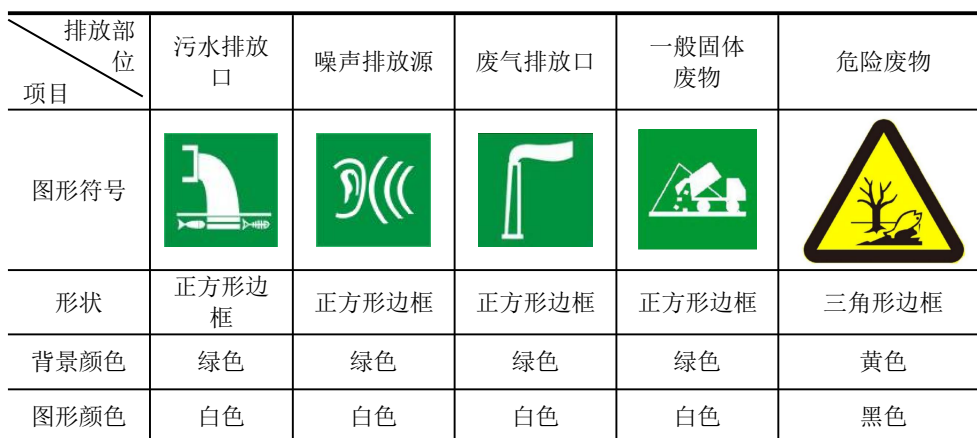
表 5-2 厂区排污口图形符号（提示标志）一览表

规范化排放口：排放口应预留监测口做到便于采样和测定流量，并设立标志（有要求监控的项目应论述）。执行《环境图形标准排污口(源)》(GB15563.1-1995)及《环境保护图形标志-固体废物贮存(处置)场》(GB15562.2-1995)及其2023年修改单要求。见表5-2，标志牌应设在与之功能相应的醒目处，并保持清晰、完整。