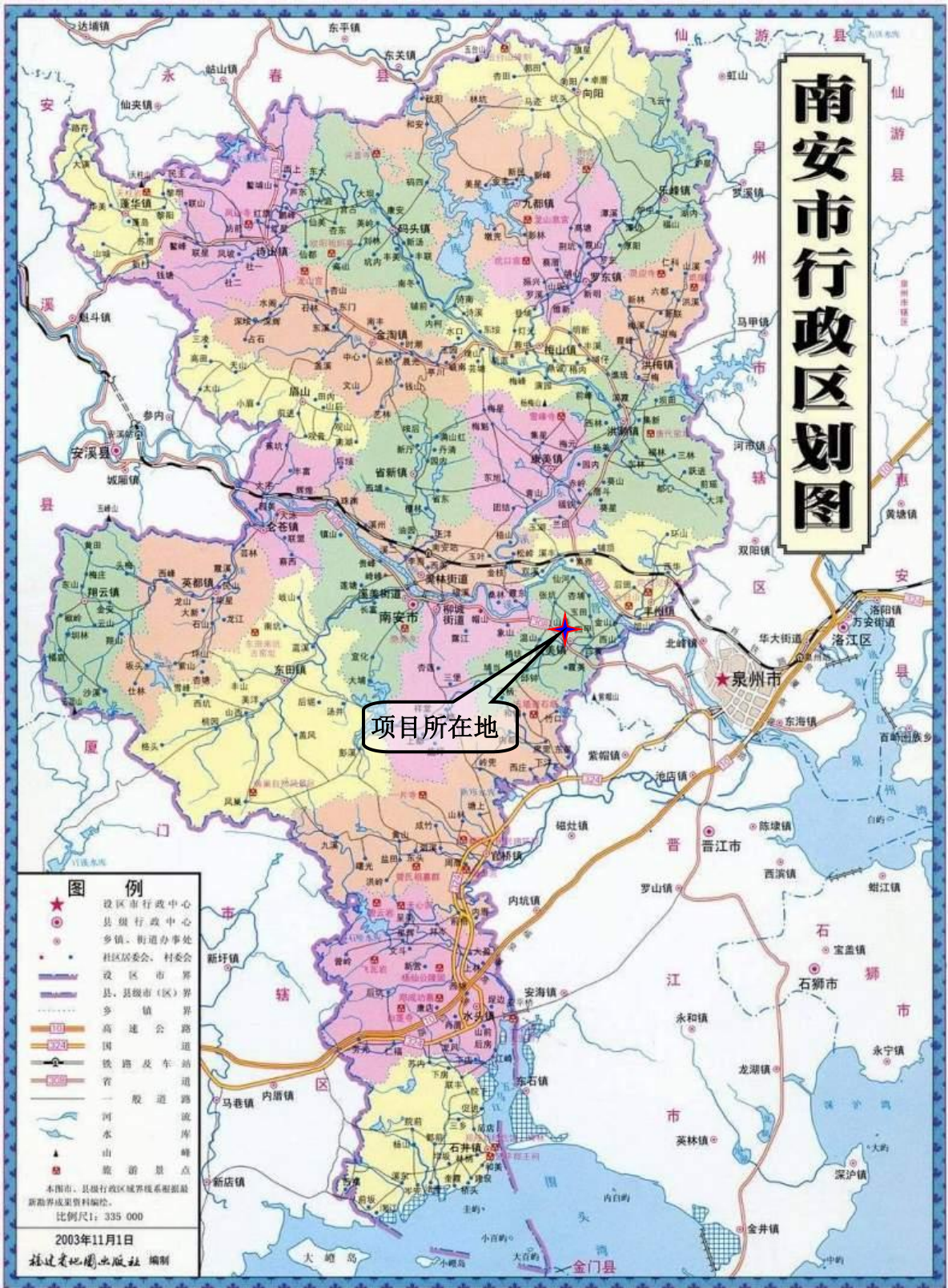
附图 1 项目地理位置图