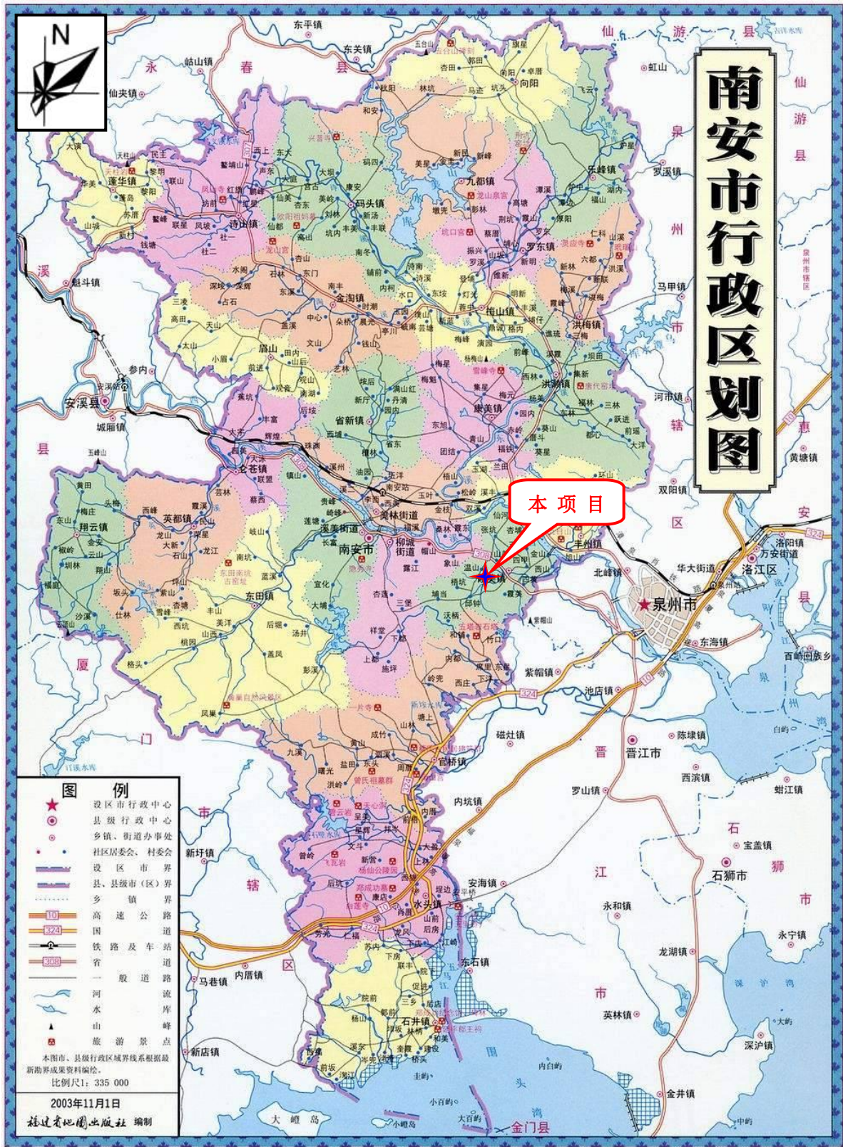
附图1 项目地理位置图