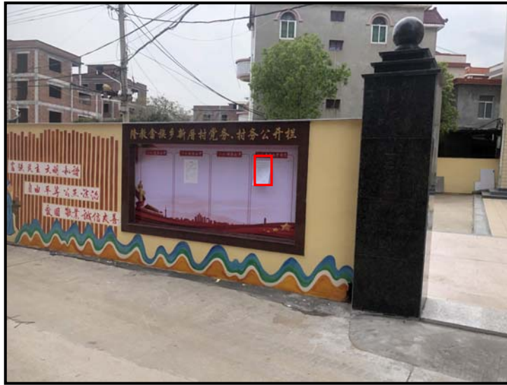
隆教畲族乡新厝村党务、村务公开栏公示照片