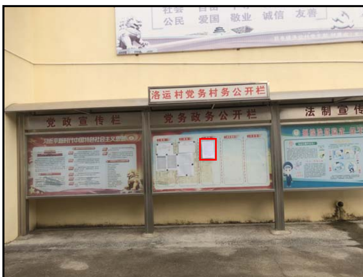
前亭镇洛运村村党务村务公开栏公示照片