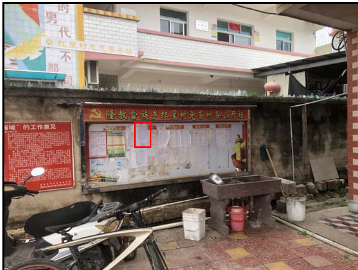
隆教畲族乡红星村党务村务公开栏公示照片