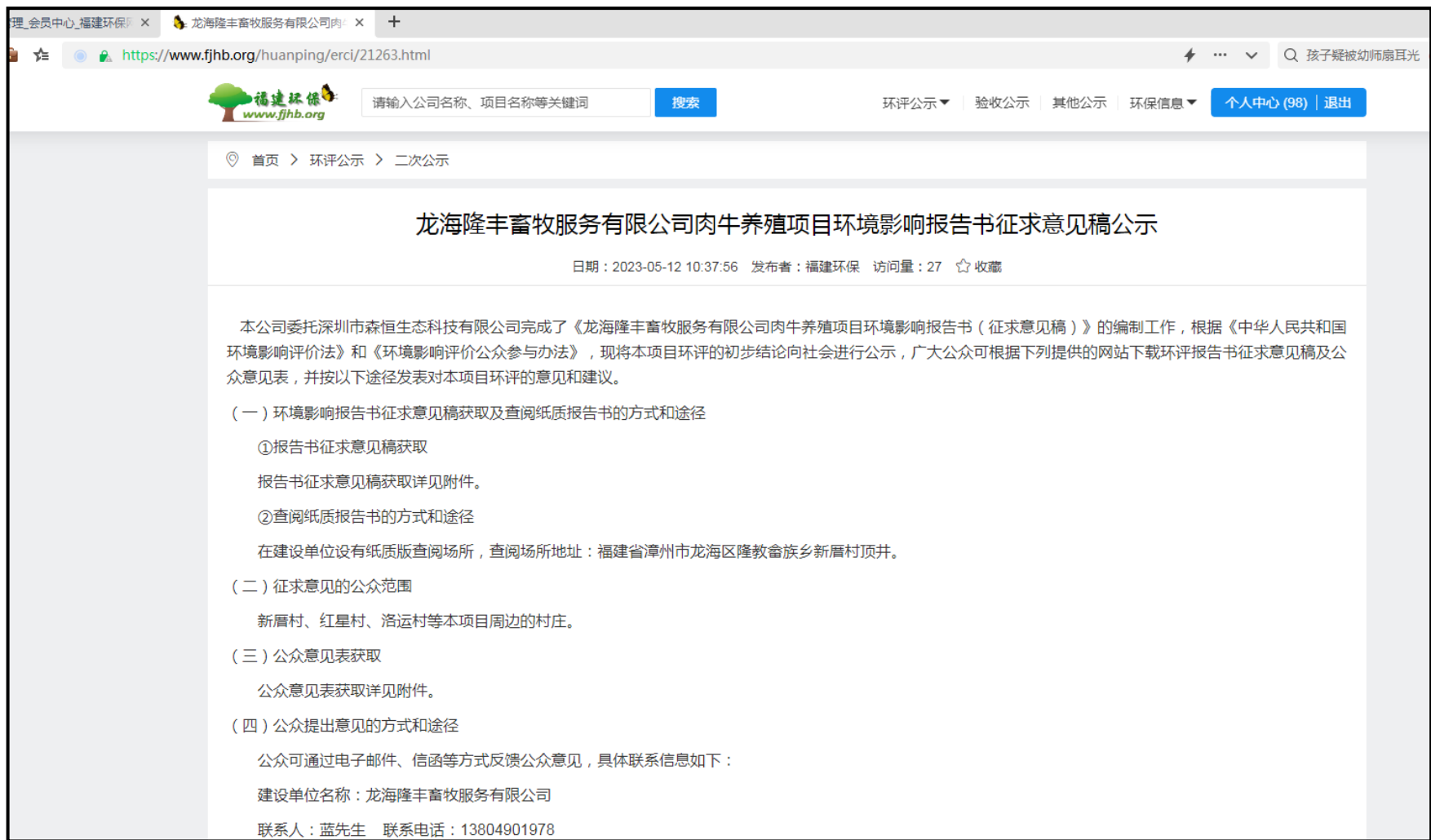
图 3.2-1 项目环境影响报告书征求意见稿网络公示截图