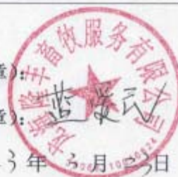
图 2.2-2 项目委托书