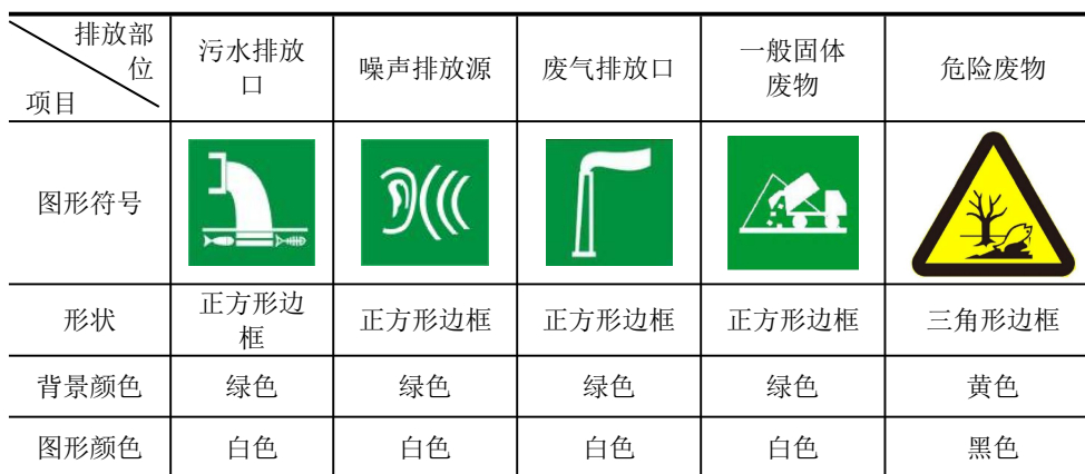
表 5-2 厂区排污口图形符号（提示标志）一览表

规范化排放口：排放口应预留监测口做到便于采样和测定流量，并设立标志（有要求监控的项目应论述）。执行《环境图形标准排污口(源)》(GB15563.1-1995)及《环境保护图形标志-固体废物贮存(处置)场》(GB15562.2-1995)及其2023年修改单要求。见表5-2，标志牌应设在与之功能相应的醒目处，并保持清晰、完整。