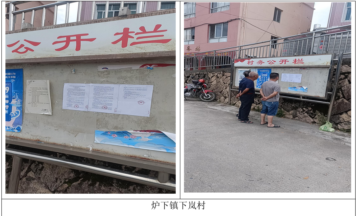
图 3.2-4 本项目征求意见稿现场二次公示

本项目环境影响报告书征求意见稿的公示内容选取项目评价范围内的炉下镇下岚村宣传栏进行了公示，于2022年10月15日在各村的宣传栏中进行了张贴，公示张贴的照片详见图3.2-3。项目粘贴区域均位于项目的评价范围内，选取符合《办法》中的要求。