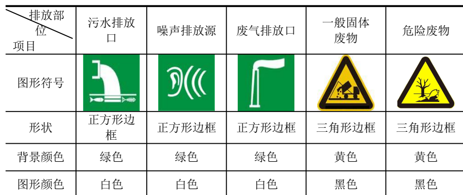
表 5-1 厂区排污口图形符号（提示标志）一览表

规范化排放口：排放口应预留监测口做到便于采样和测定流量，并设立标志（有要求监控的项目应论述）。执行《环境图形标准排污口(源)》（GB15563.1-1995）及《环境保护图形标志-固体废物贮存（处置）场》（GB15562.2-1995）及 2023 修改单相关要求。见下表，标志牌应设在与之功能相应的醒目处，并保持清晰、完整。