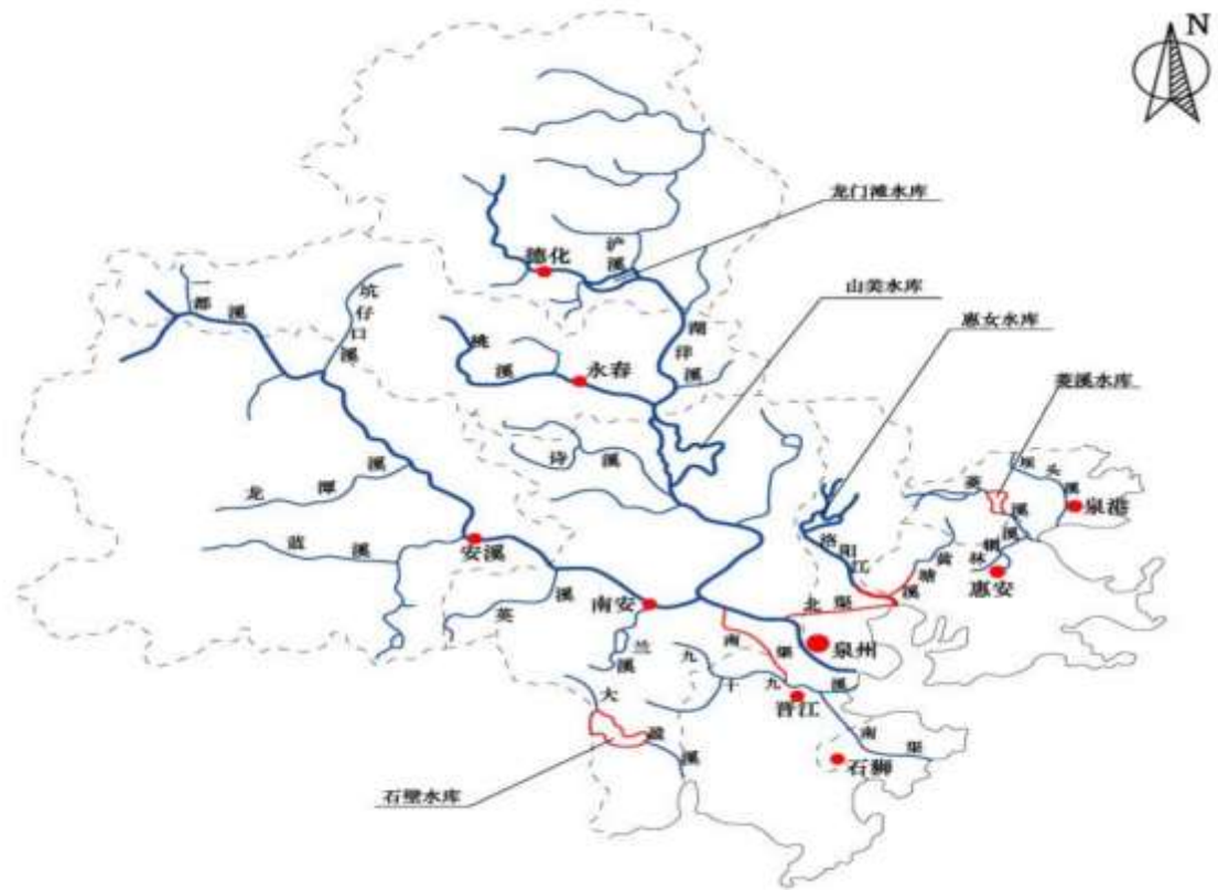
图 3.1-1 泉州市水系图