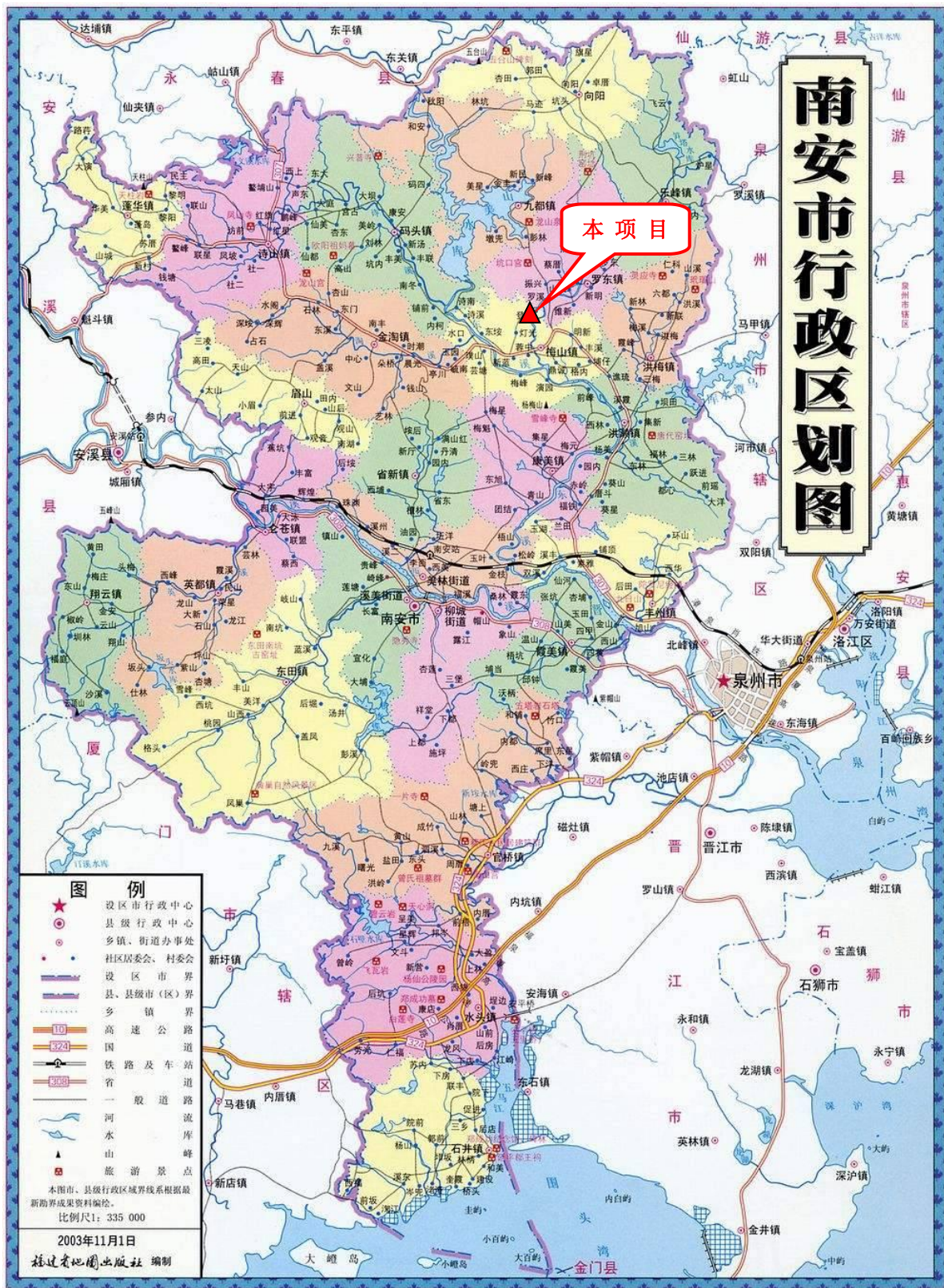
附图1 项目地理位置图