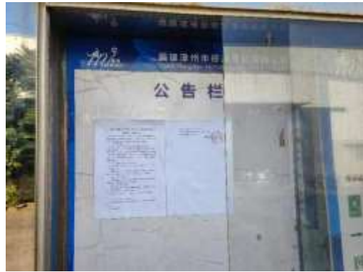
德昌皮业有限公司宣传栏