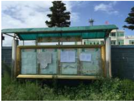
赤湖工业区管委会宣传栏