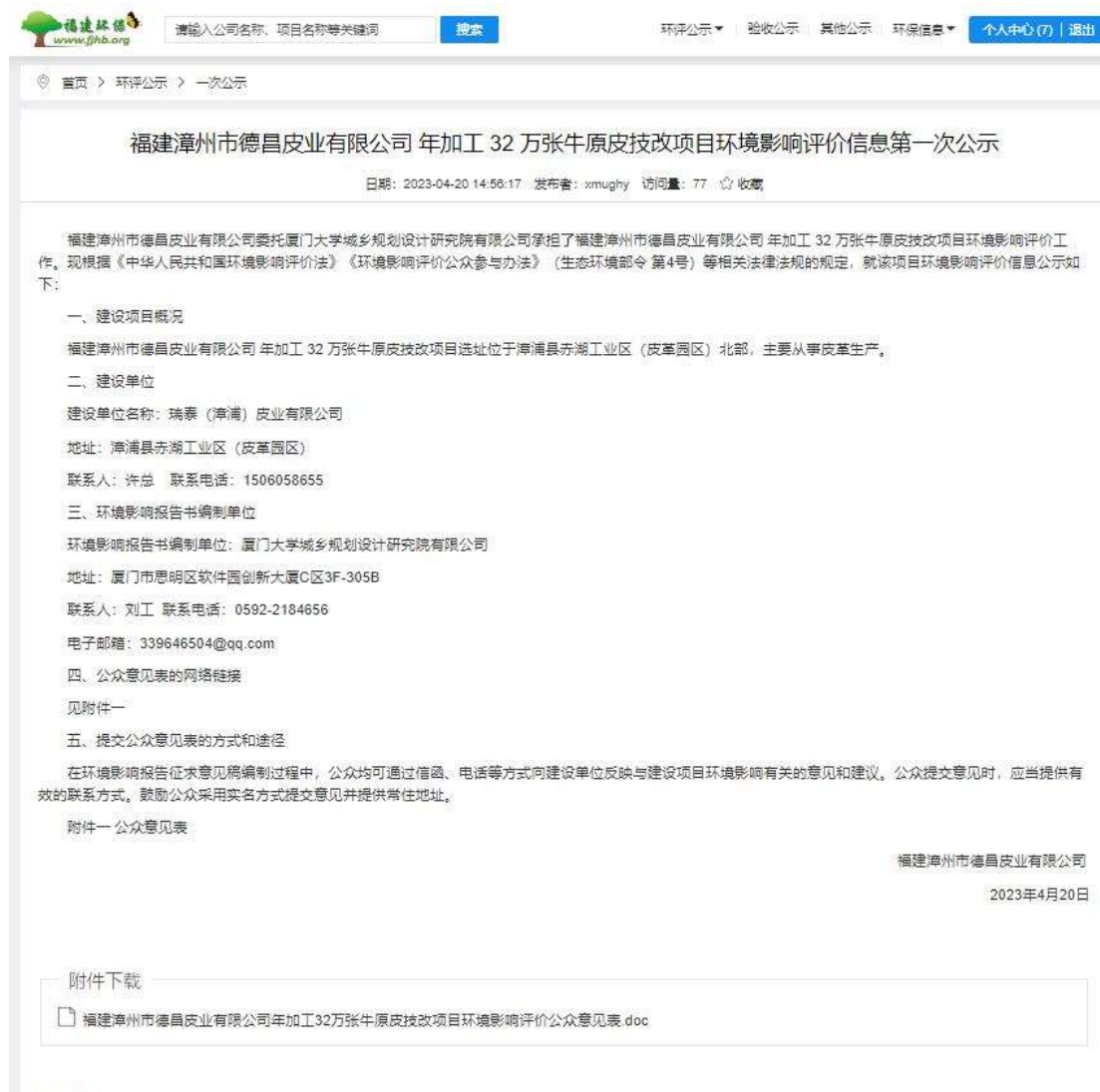
图 2.1 第一次信息公示截图