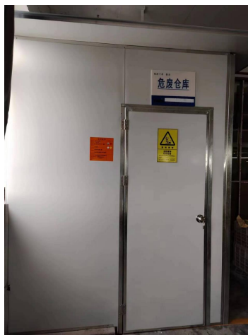
危险废物暂存场所