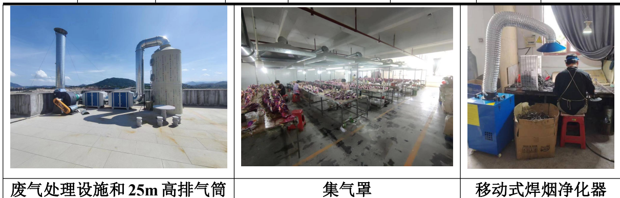
图 4-1 项目废气处理设施照片