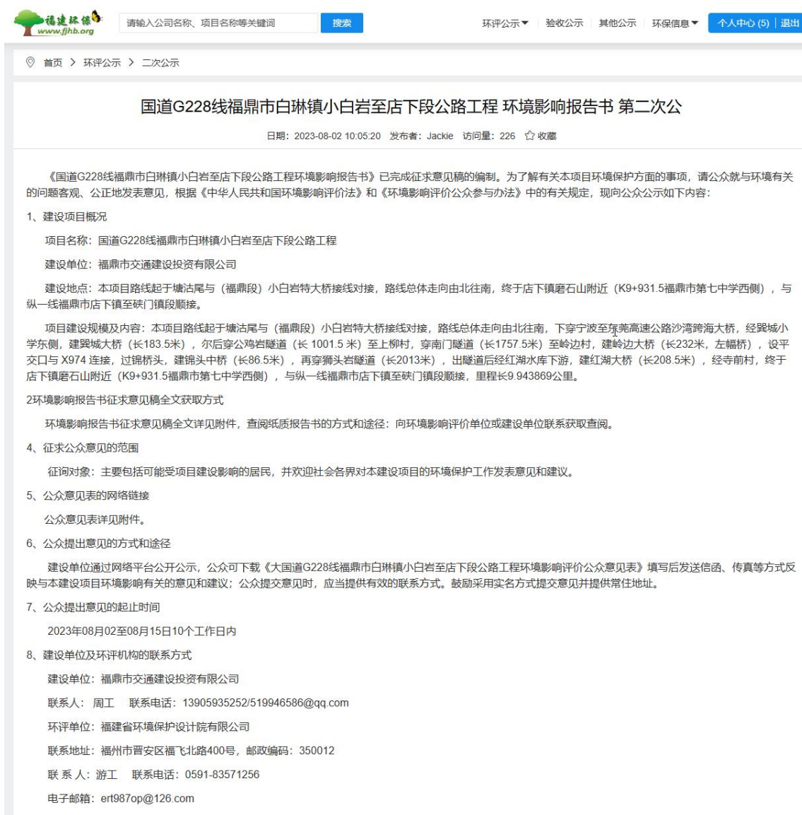
图3.2-1 征求意见稿公示截图