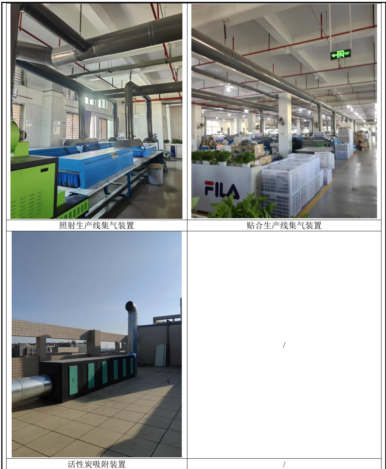
图 3-1 废气处理设施图