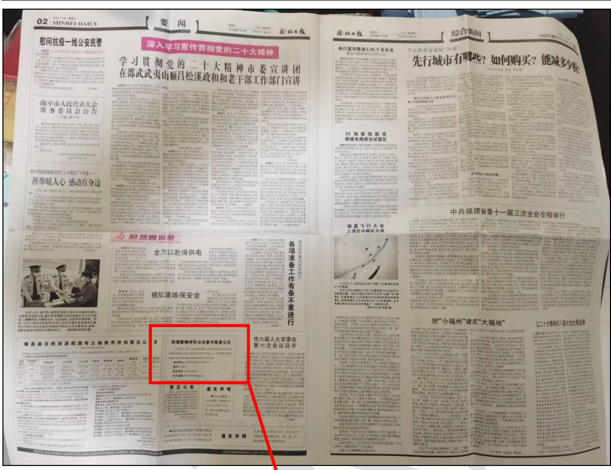
光泽县综合填埋场工程环境影响报告书公众参与说明