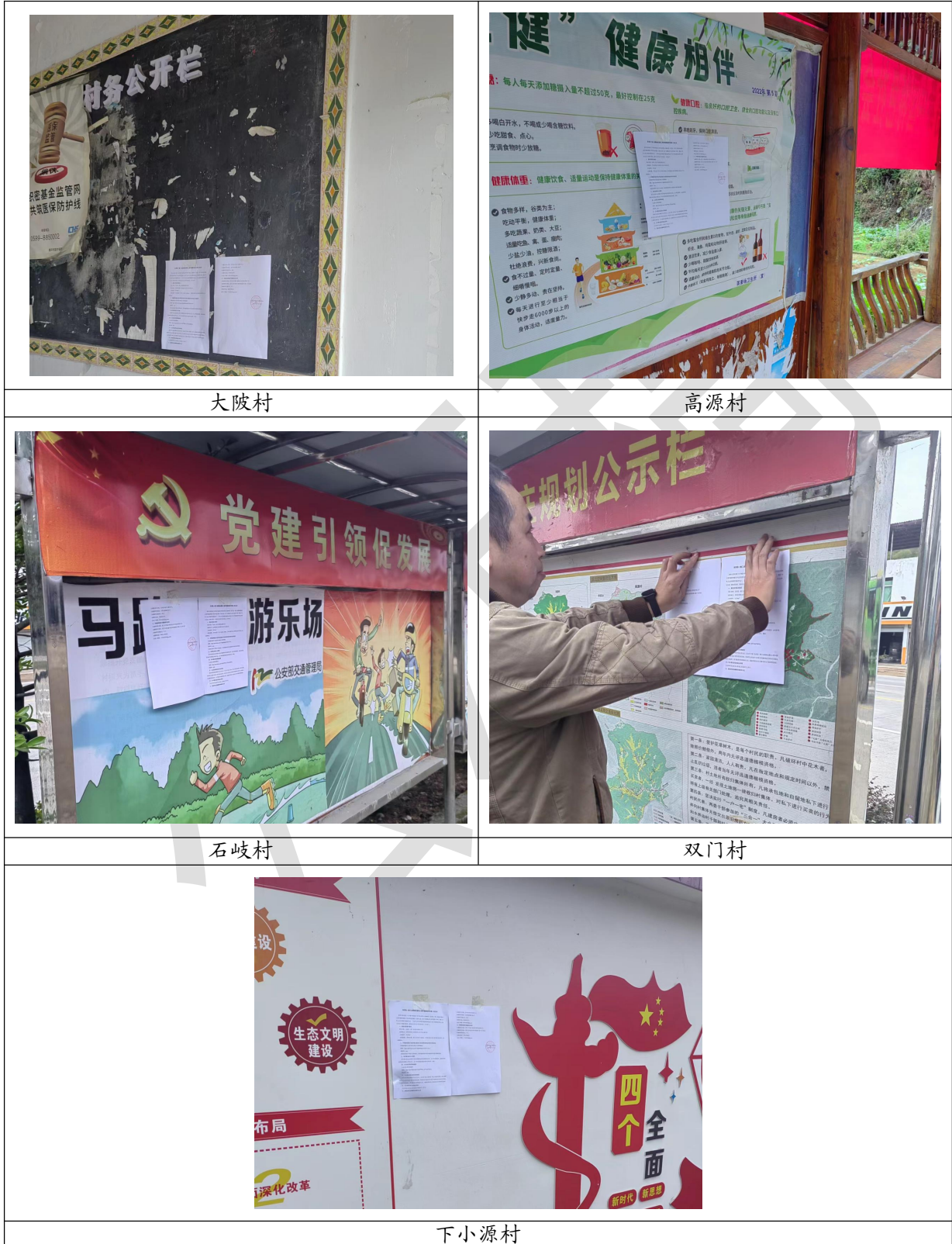
图 3.2-4 现场张贴二次公示情景

建设单位于 2022 年 11 月 22 日，在项目周边的大陂村、高源村、石岐村、双门村、下小源村公告栏张贴公示，现场公示张贴情况见图 3.2-4。