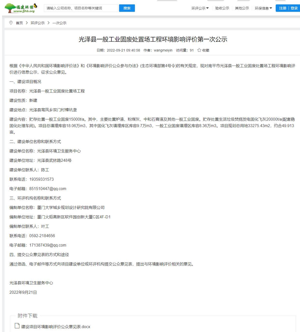
图 2.2-1 第一次网上信息公示截图

项目建设单位(光泽县环境卫生服务中心)在确定环境影响报告书编制单位后7个工作日内,于2022年9月21日在“福建环保”网站公示了本项目环评基本情况,符合《环境影响评价公众参与办法》第九条要求,公示网址为 https://www.fjhb.org/huanping/yici/15872.html 。公示截图见图2.2-1。因原拟项目名称为“光泽县一般工业固废处置场工程”,故第一次及第二次公示阶段按该名称草拟。