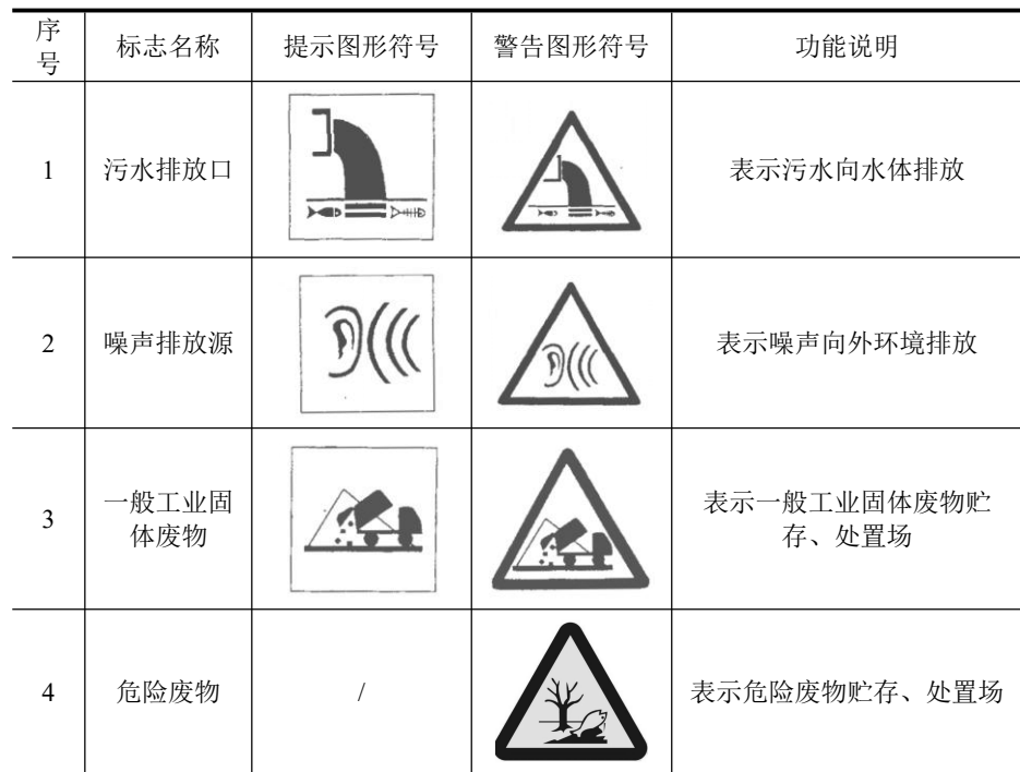
表 5-1 各排污口（源）标志牌设置示意图