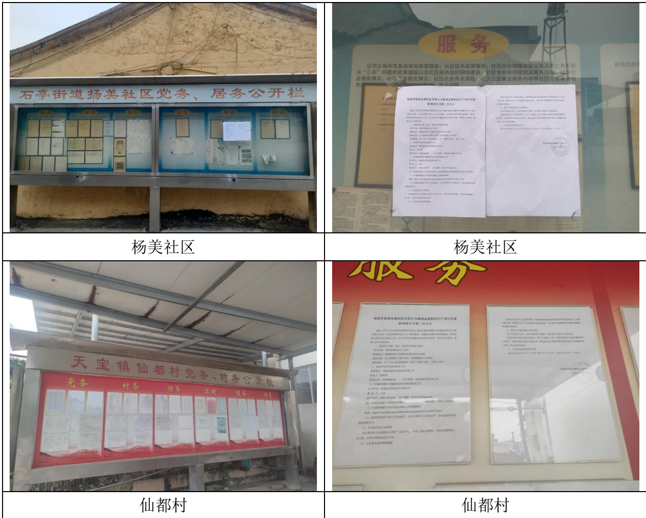
图 3.2-4 征求意见稿现场张贴公示照片