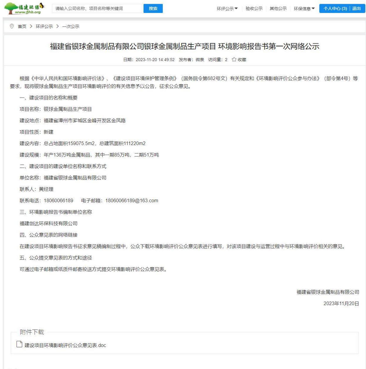
图 2.1-1 项目公众参与信息第一次网络公示公示截图