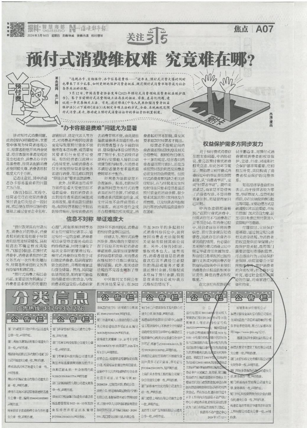
图 3.2-2 3 月 14 日征求意见稿报纸公示截图

海峡都市报创刊于 1997 年，是福建日报社出版的报刊，是福建省第一张面向全省的综合性都市生活报，每日出版。具有漳州市地域的广大阅读受众，因此适合作为本项目的报纸公示媒介。