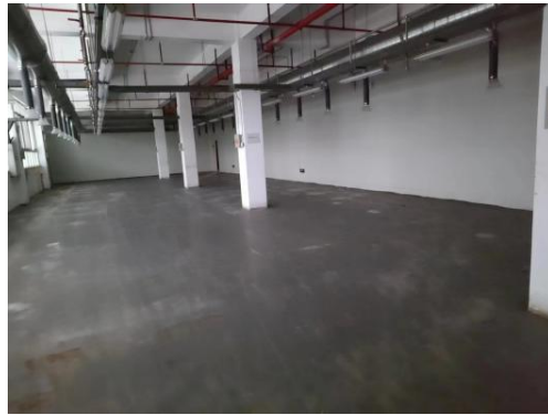
图 2-1 租赁场地现状

本项目建设单位的产品与中探探针(福建)有限公司在此生产的部分产品类似,因此此前生产布置的环保设施保留,并销售给立轲德公司使用。