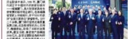
厦门市商业银行在三明市开设第四家支行，工作人员合影。

厦门市商业银行在三明市开设的第四家支行，将秉承“以客户为中心”的服务理念，提供全方位的金融服务。支行将重点支持小微企业、个体工商户和城乡居民的金融需求，助力三明市经济社会高质量发展。厦门市商业银行表示，未来将继续加大在三明的投入，不断提升服务质量和效率。