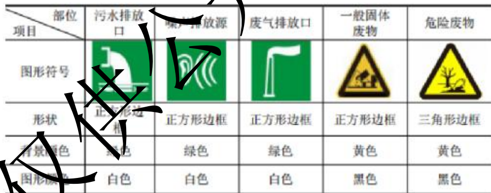
图 5-1 排放口标识图

排放口应预留监测口做到便于采样和测定流量，并设立标志（有要求监控的项目应论述）。执行《环境图形标准排污口（源）》（GB15563.1-1995）、《危险废物识别标志设置技术规范》（HJ 1276-2022）、《环境保护图形标志-固体废物贮存（处置）场》（GB15562.2-1995）及其 2023 年修改单要求，具体详见下图。标志牌应设在与功能相应的醒目处，并保持清晰、完整。