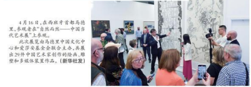
4月16日,在西班牙首都马德里,参观者在“自然而然——中国当代艺术展”上参观。

【新华社马德里17日电】由中国当代艺术展组委会主办的“自然而然——中国当代艺术展”在西班牙首都马德里开幕。此次展览由马德里中国文化中心和安多基金会联合主办,共展出29件中国当代艺术作品,包括油画、雕塑和多媒体装置作品。 展览以“自然而然”为主题,旨在向世界展示中国当代艺术的多样性和活力。参展艺术家包括多位在国际艺术界享有盛誉的艺术家,他们的作品涵盖了传统与现代、东方与西方等多种风格。 开幕式上,主办方表示,此次展览是两国文化交流的重要成果,也是中国当代艺术走向世界的重要一步。通过展览,观众可以近距离感受中国当代艺术的魅力,增进对中华文化的理解和认识。 展览将持续至4月25日,每日上午10时至下午6时开放。门票免费,观众可通过官方网站或电话预订。