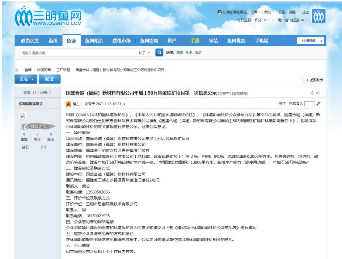
图 2.1-1 第一次环评公示截图

本项目选择在三明小鱼网上进行公示 http://bbs.0598yu.com/forum.php?mod=forumdisplay&fid=614 ，公示期为10个工作日，公示时间：2023年1月18日~2月1日。网络公示截图如下：