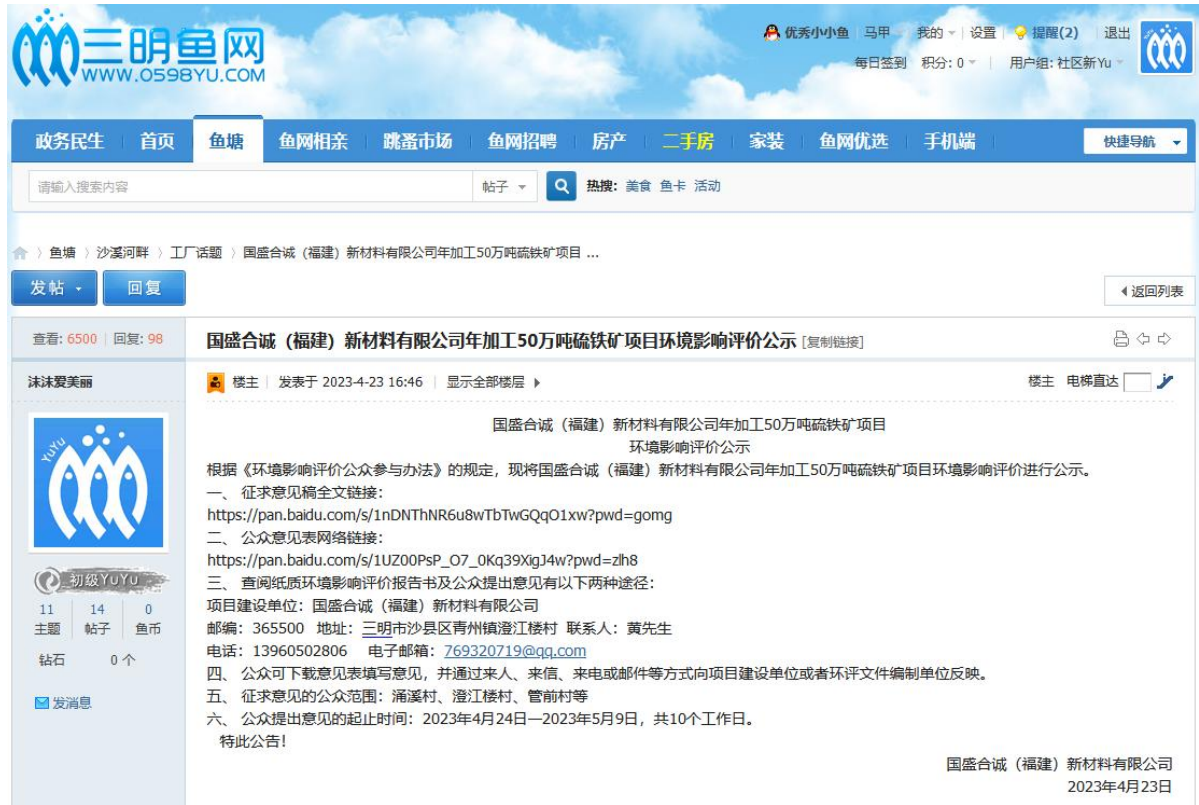
图 3.2-1 征求意见稿网络公示截图