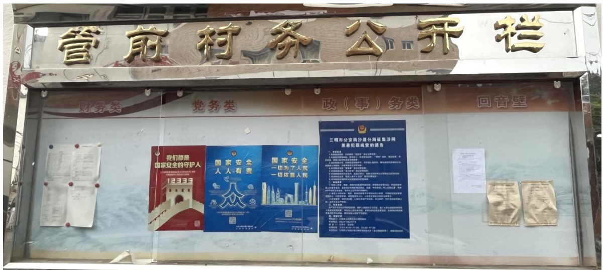
图3. 2-3 征求意见稿张贴公示照片