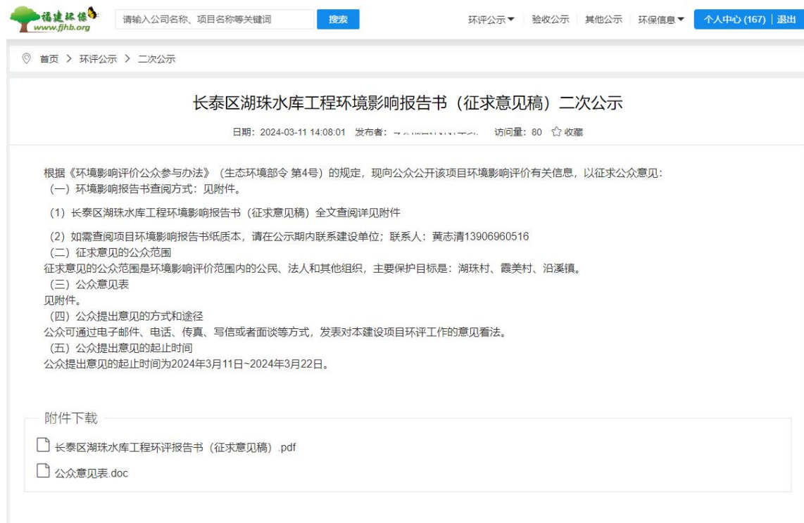
图 3.2.1 网络公示截图

我司根据福建创达环保科技有限公司编制的环境影响报告书征求意见稿，于2024年3月11日在福建环保网（ https://www.fjhb.org/huanping/erci/28330.html ）发布了本项目征求意见稿网络公示。公示情况见图 3.2.1。