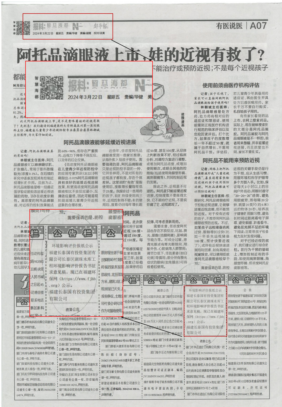
图 3.2.3 第二次报纸公示