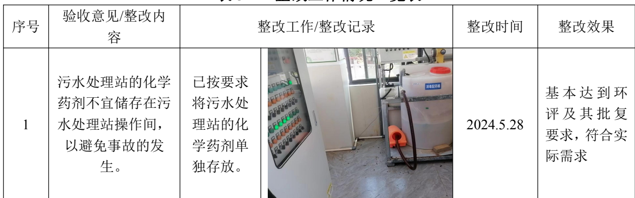
表 3-1 整改工作情况一览表

项目实际建设内容较为简单，整改工作情况主要集中在提出验收意见后，采取的各项整改工作、具体整改内容、整改时间及整改效果等详见下表。