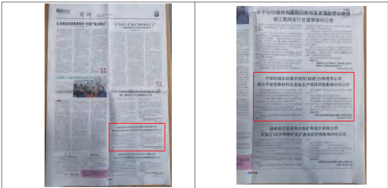
图 3-2 报纸第一次公示截图