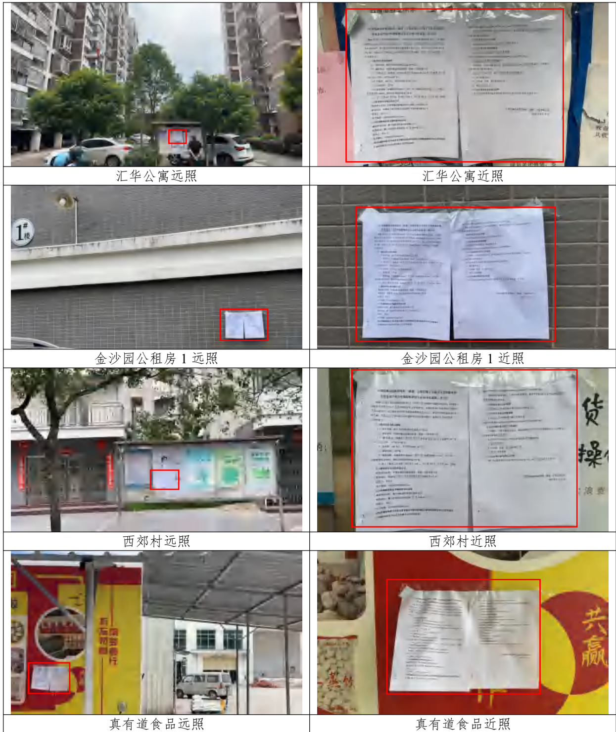
图 3-4 现场张贴公告照片