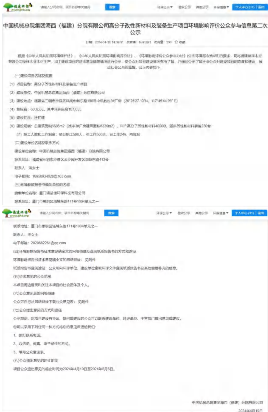
图 3-1 征求意见稿网络公示截图