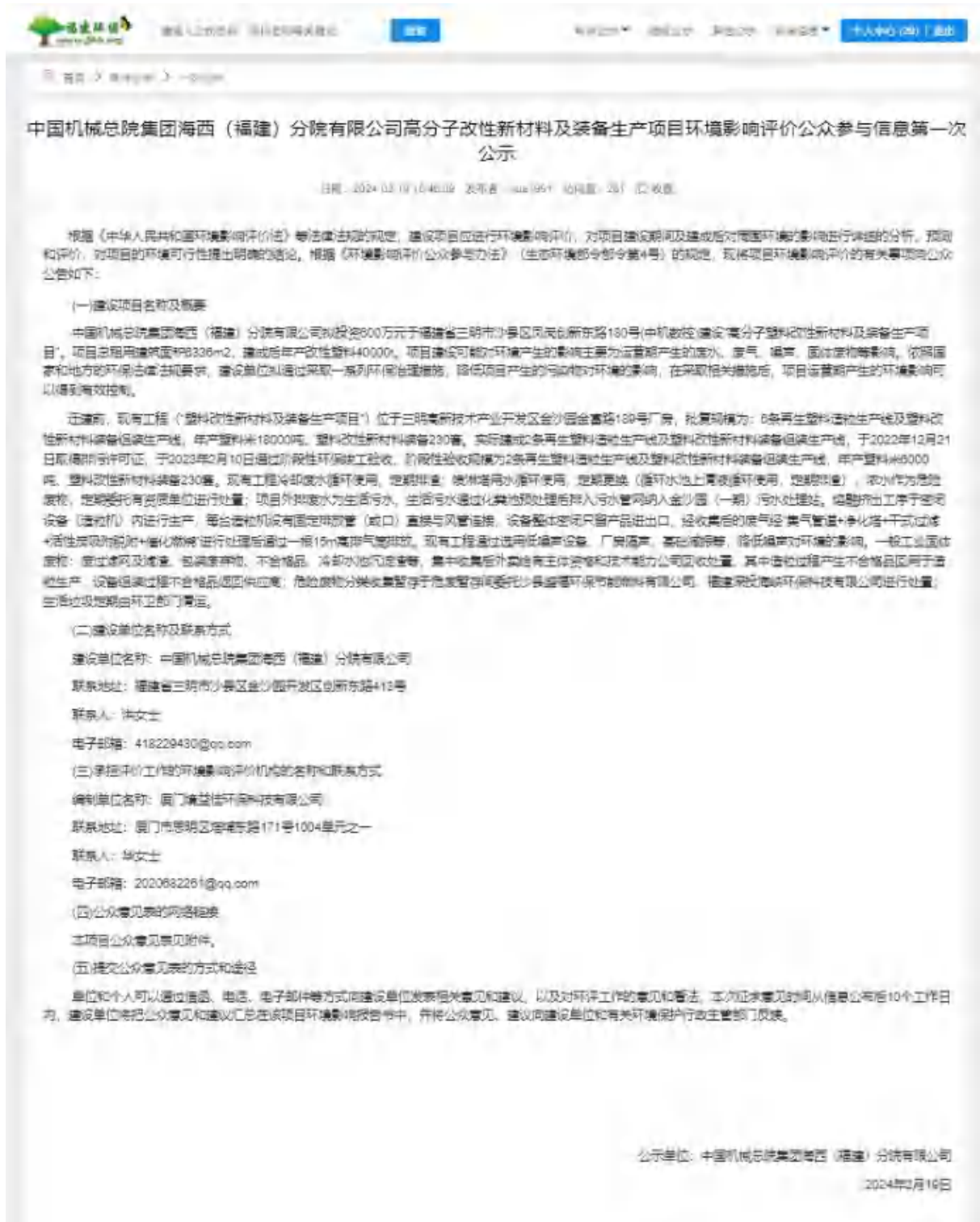
图 2-1 首次网络信息公示截图