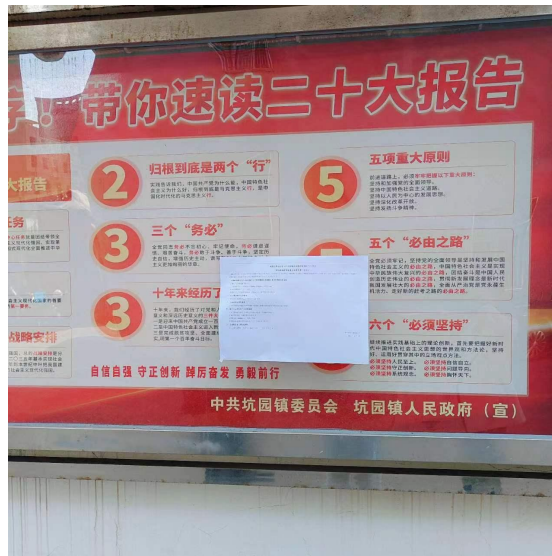
图 2.2-2 坑园镇现场公示照片