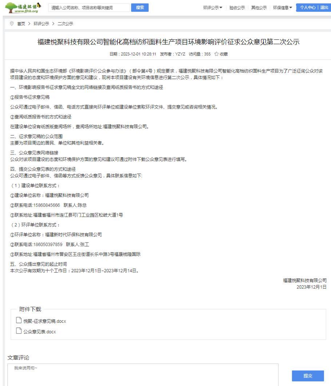
图 3.2-1 二次公示信息截图

二次公示网址： https://www.fjhb.org/huanping/erci/25916.html