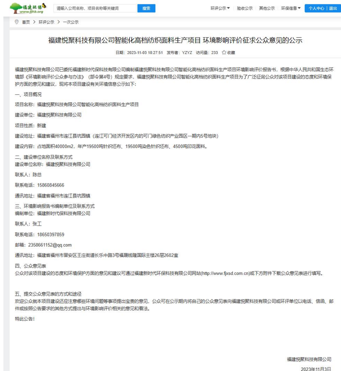
图 2.2-1 首次公示信息截图

首次公示网址： https://www.fjhb.org/huanping/yici/25227.html