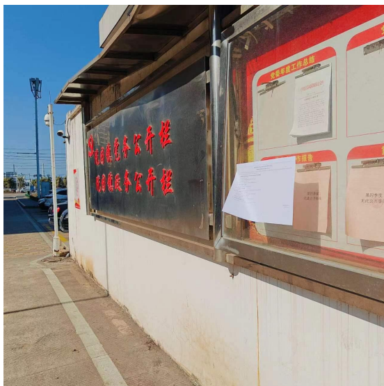
图 3.2-3 坑园镇现场公示照片