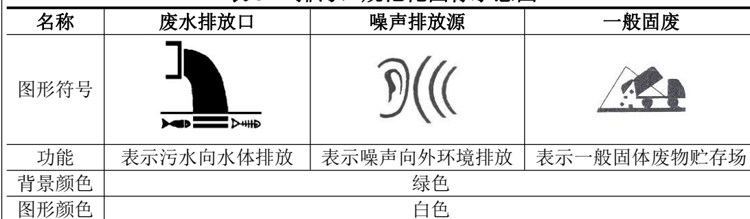
表 5-2 排污口规范化图标示意图

排放口应预留监测口做到便于采样和测定流量，并设立标志，根据原国家环保总局《排污口规范化整治技术要求（试行）》，企业所有排放口包括水、气、声、固体废物，必须按照“便于计量监测、便于日常现场监督检查”的原则和规范化要求，设置与之相适应的环境保护图形标志牌，绘制企业排污口分布图。排污口标志图形符号见表 5-2。